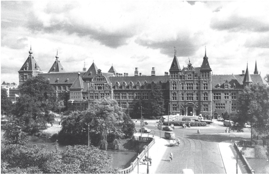
Het KIT in Amsterdam