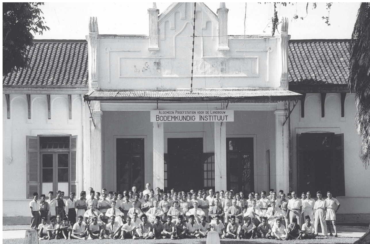
Het bodemkundig instituut in Bogor in 1948: '...15 academici en 130 man middelbaar en lager personeel...'